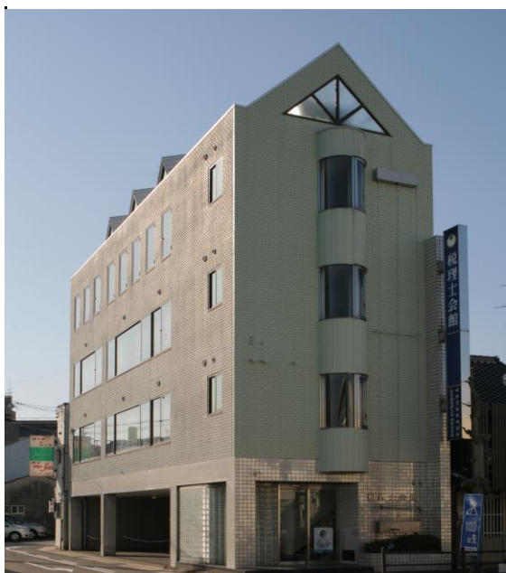
(写真 : 岐阜北税理士会館)