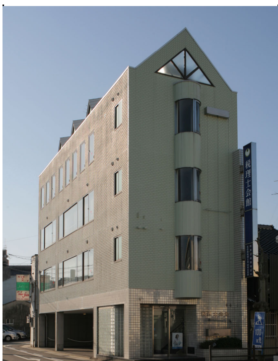
(写真 : 岐阜北税理士会館)