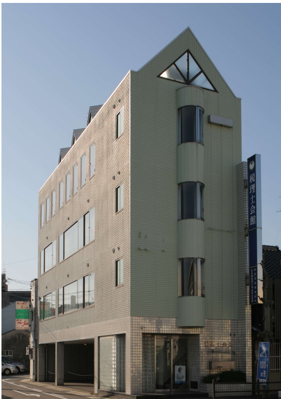
(写真：岐阜北税理士会館)